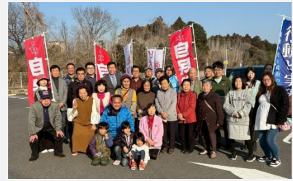
スーパーセンターオークワいなべ店前