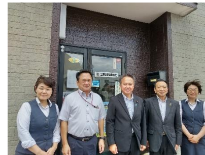
〈三重県警備業協会〉